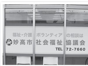
【社会福祉協議会事務所】