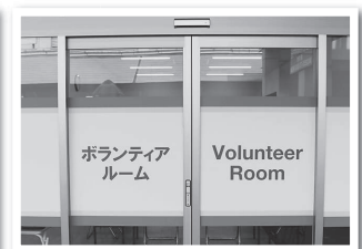
【ボランティアルーム】