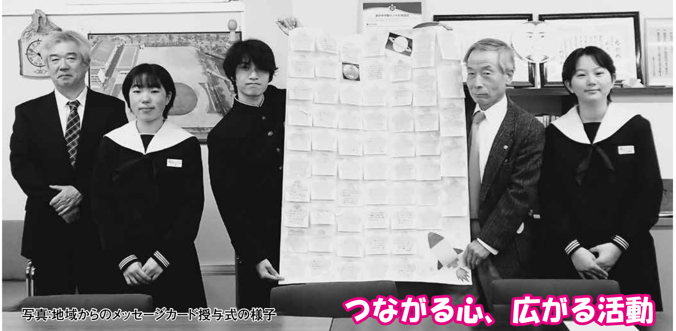
写真:地域からのメッセージカード授与式の様子