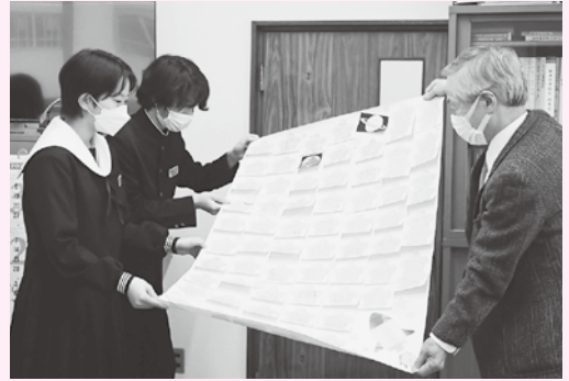
令和6年度の生徒会役員へ地域のメッセージを渡す市民児協片所会長

生徒会役員の3名は、早速メッセージに目を通し、「廊下へ展示したり、校内放送を通じて全校生徒に伝え、自分たちも活動をつないでいきたい」と、お礼の言葉とともに意気込みを語ってくれました。