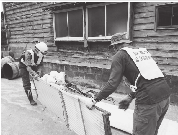
水に浸かった物の運び出し

参加したボランティア14人は、村上市川辺地区で住宅の泥出しや片付け、掃除などを行いました。