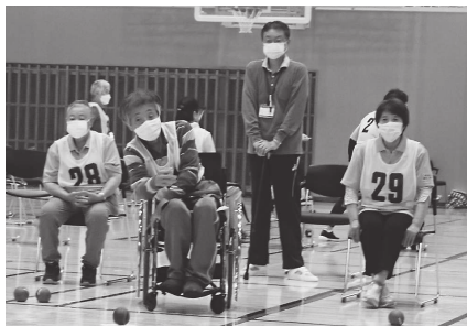
パラリンピック種目の「ポッチャ」

3年ぶりの再会で、参加者から「久しぶり～、元気だったかね～」と声が聞かれました。