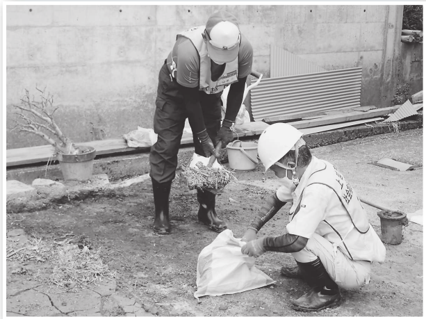
敷地内にたまった泥出し