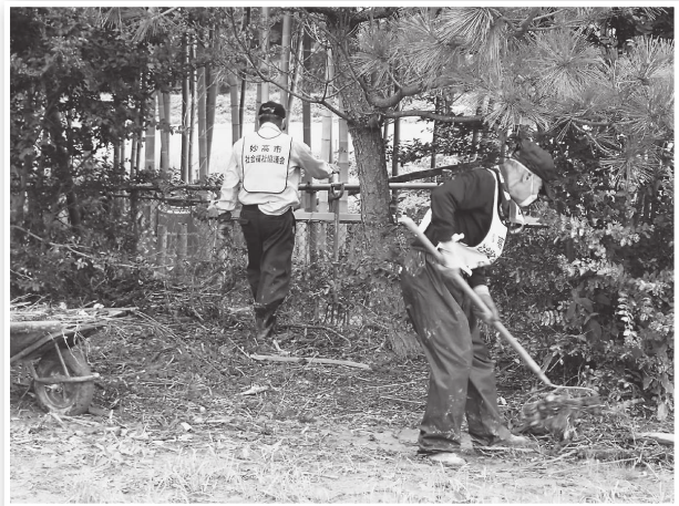
流れてきた流木やゴミの片付け